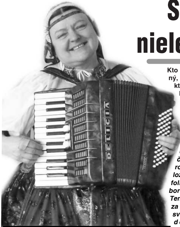
Števká si publikum získala len čo vyšla na javisko

"Všetci, kto ju dobre poznáme, si uvedomujeme, že práve ona si zaslúži toto pekné ocenenie za jej dlhodobé výborné výsledky v oblasti umenia i záujmovej umeleckej činnosti a to v rámci folklóru, divadla aj tradičných ľudových remesiel. Náplňou jej života bola jej práca, ktorá bola jej koníčkom a doslova srdcovou záležitosťou, či už pôsobila ako učiteľka a neskôr riaditeľka Základnej umeleckej školy v M. Kamení a vychovávateľka Centra voľného času vo V. Krtíši, umelecká vedúca FS súboru Perlička či divadelných súborov. Jej rukami, no najmä srdcom bijúcim pre ľudovú kultúru, prešli desiatky, možno aj stovky detí, v ktorých zapálila záujem o zvyky aj remeslá našich predkov."