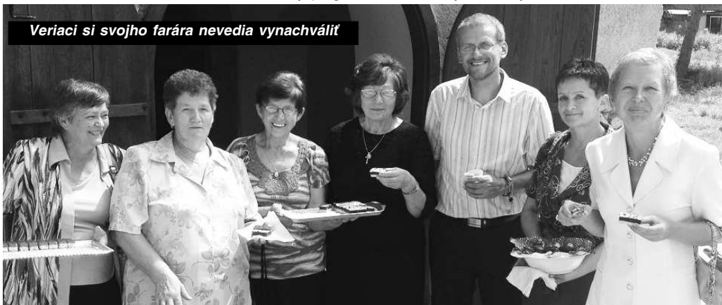
Veriaci si svojho farára nevedia vynachváliť

KRYTÁ PLAVÁREŇ A POSILNOVNÁ: Pondelok 14.00 - 20.00 h., Utorok - Piatok 9.00 - 20.00 h., Sobota - Nedeľa 10.00 - 20.00 h. Pokladňa do 19.00 h., 047/48 308 19 ŠPORTOVÁ HALA: Pondelok - Piatok 7.30 - 21.00 h., Sobota - Nedeľa 8.00 - 21.00 h. Tel. č. 0904 335 750