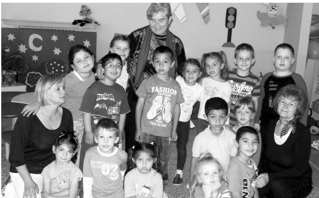
Slová tety rozprávarky (hore v strede) padajú do malých srdiečok detí