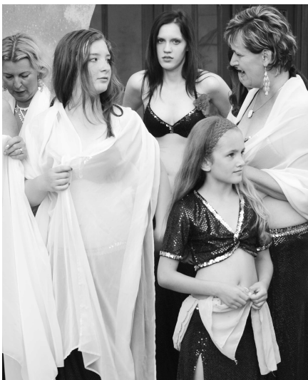
Brušné tanečnice z oboch Ďarmôt boli dobrým úvodom kultúrneho programu