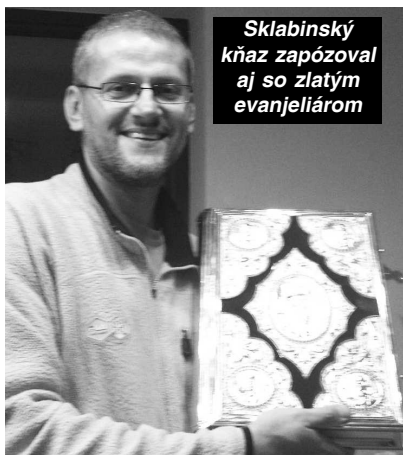
Sklabinský kňaz zapozoval aj so zlatým evanjeliom