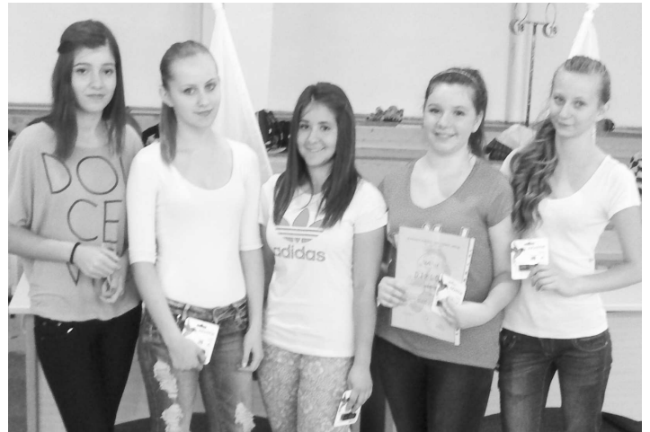
Neninskí žiaci získali 1. miesto na obidvoch stupňoch - vľavo mladší, vpravo staršie žiačky