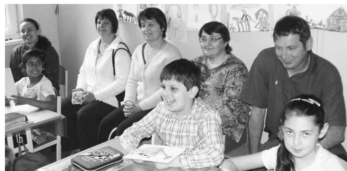
Tváre rodičov a detí svedčia o vydarenej otvorenej hodine v 2. triede