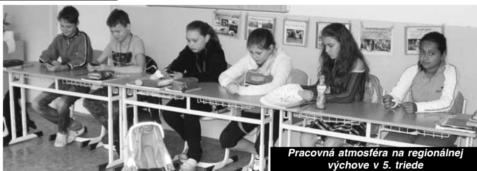
Pracovná atmosféra na regionálnej výchove v 5. triede