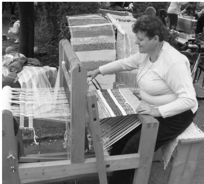
Nielen slovom ale aj ručnou prácou - tkaním - zachováva odkaz predkov