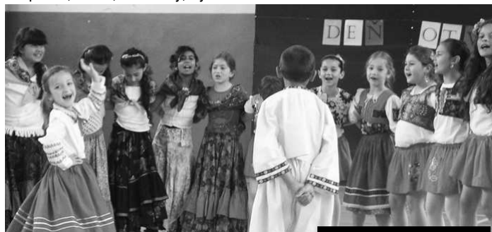
Vystúpenie žiakov 1. stupňa z krúžku Hudba, spev, tanec