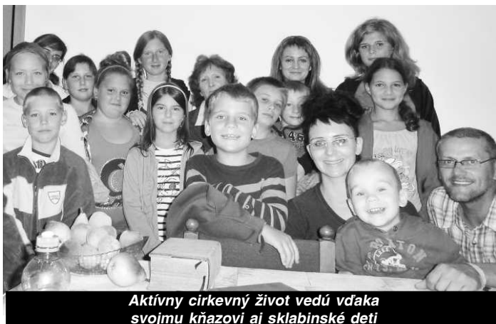
Aktívny cirkevný život vedú vďaka svojmu kňazovi aj sklabinské deti