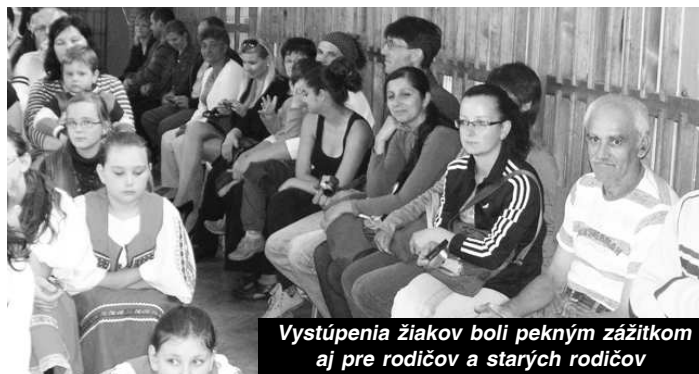
Vystúpenia žiakov boli pekným zážitkom aj pre rodičov a starých rodičov