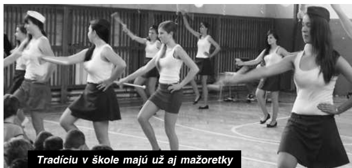
Tradíciu v škole majú už aj mažoretky