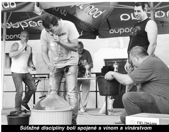
Súťažné disciplíny boli spojené s vínom a vinárstvom