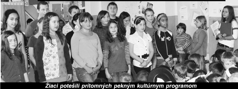
Žiaci potešili prítomných pekným kultúrnym programom