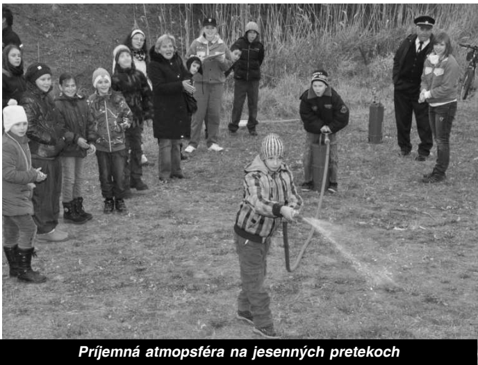
Príjemná atmosféra na jesenných pretekoch