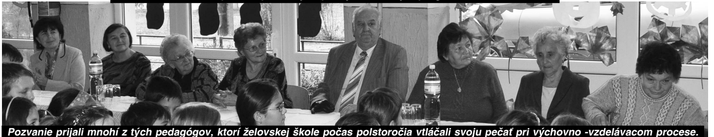
Pozvanie prijali mnohí z tých pedagógov, ktorí želovskej škole počas polstoročia vtlačili svoju pečať pri výchovno -vzdelávacom procese.