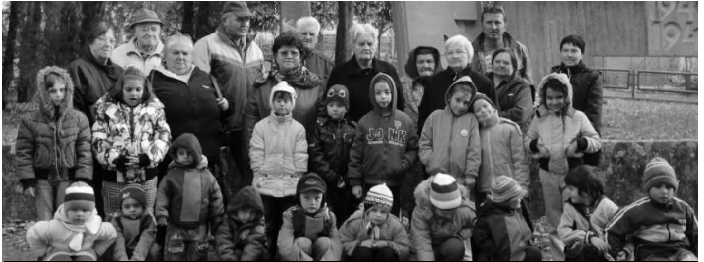
Magický dátum využili aj v S. Plachtinciach na vzdanie úcty padlým vo vojne. Za hlasu zvonov deti položili kvety k pamätnej tabuli, dospelí zapálili sviece a prečítali Výzvu trenčianskych vojakov.