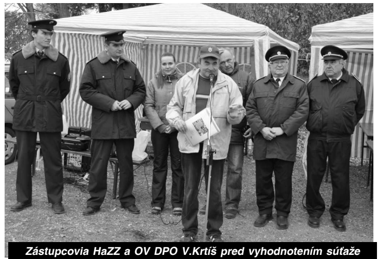
Zástupcovia HaZZ a OV DPO V.Krtíš pred vyhodnotením súťaže