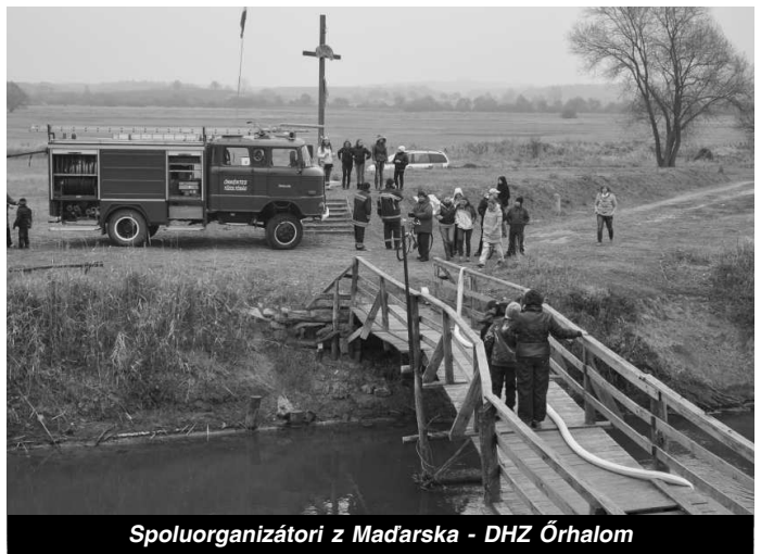
Spoluorganizátori z Maďarska - DHZ Ŕhalom