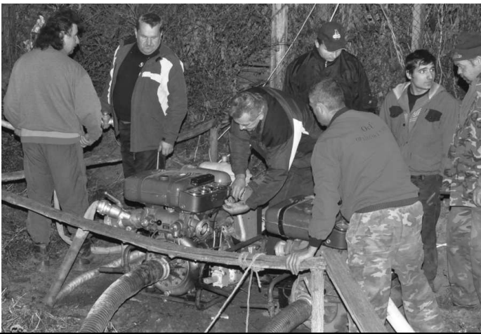
Členovia DHZ Záhorce a DHZ Opatovská N.Ves