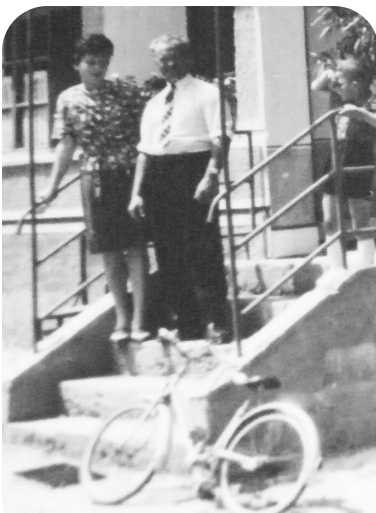
S manželkou na dvore rodičovského domu

rú chce ísť. Tak teda podpísal. Dcéra potom vyštudovala chémiu a robila v Košiciach. Teraz je už na dôchodku.