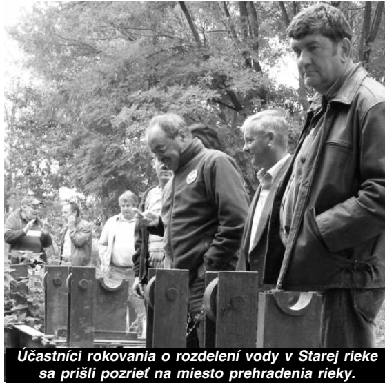
Účastníci rokovania o rozdelení vody v Starej rieke sa prišli pozrieť na miesto prehradenia rieky.

Niekoľko mesiacov trvajúci spor o vodu v oboch korytách Starej rieky sa teda nateraz skončil zmierom zainteresovaných strán. Aký vplyv bude mať toto rozdelenie vody na okolitú prírodu po ročnom pôsobení, a aké rozhodnutie prijmu zodpovedné orgány po roku, uvidíme.