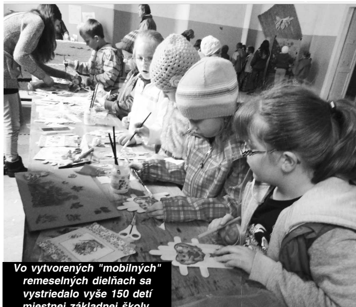
Vo vytvorených "mobilných" remeselných dielnach sa vystriedalo vyše 150 detí miestnej základnej školy.

remeselných dielnach - tkáčskej, kovárskej, rezbárskej, hrnčiarskej a tiež v tvorivej dielni detí sa vystriedalo vyše 150 detí miestnej základnej školy. S nadšením si skúšali výrobu drevených prasietok, kovanie príveskov, výrobu tanierikov a hrnčekov, tkanie kobercov na krosnách a v neposlednom rade zaujímavú servítkovú techniku - decoupage. Podľa záujmu sa deti striedali v jednotlivých dielnach vo veľkej sále kaštiela. Mnohí mali záujem pozrieť si zaujímavú