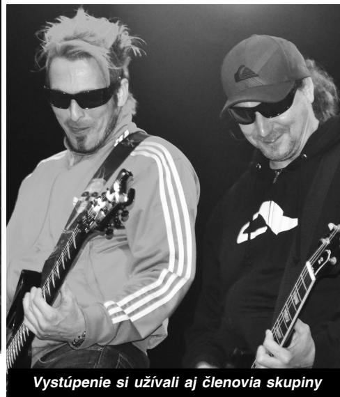
Vystúpenie si užívali aj členovia skupiny