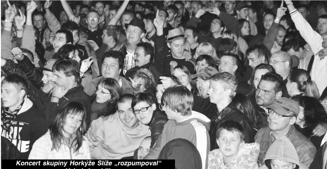
Koncert skupiny Horkýže Slíže „rozpumpoval“ celé hojné publikum

Po úspešnom letnom HRKOfeste na sklabinom letisku sa v našom okrese opäť uskutočnil skvelý hudobný festival, tentoraz ochutený výberom značkových pív zo Slovenska, Čiech, Nemecka, Belgicka, Írska či Švédska. Tak ako Nemci majú dlhoročnú tradíciu svojho pívneho mníchovského festivalu Oktoberfest, zrejme po ich vzore prihostala agentúra Kvas vínu pívnych festivalov aj na piatich slovenských miestach. Rimavská Sobota, Poprad, Veľký Krtíš, Hruštín a Liptovský Mikuláš boli vyvolenými miestami, kde si mohli milovníci zlatého moku uhasiť smäd množstvom svetových značiek piva a zároveň sa zabaviť na koncertoch slovenských kapiel. Okrem trinásťich vychytených značiek piva, z ktorých vám niektoré nikde na Slovensku bežne nenačapujú, sa tak účastníci KVASfestov vytešovali aj z dobrej rockovej muziky, ktorá sa k pivu jednoznačne hodí najviac. V piatok 19. októbra sa séria pívnych festivalov presťahovala pod hlavičkou HRKOfestu do areálu Babičkinho dvora vo V. Krtíši. Hlavným ťahákom bola známa skupina Horkýže Slíže, vyšantiť sa pred pódium však prišli aj priaznivci výborných skupín The Shed, Karpina a Before the Zero Day.