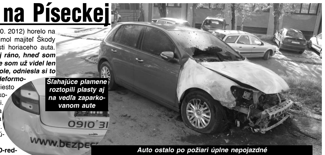
Auto ostalo po požiari úplne nepojazdné

Šľahajúce plamene roztopili plasty aj na vedľa zaparkovanom aute