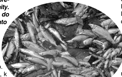
Uhynuté ryby v potoku pri Zelovciach

Pravdepodobne by k takému veľkému úhynu rýb, ktorý zaznamenali na celom úseku Krtíšskeho potoka od čističky až po S. Darmoty, nemuselo dôjsť.