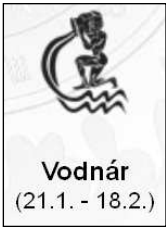
Vodnár (21.1. - 18.2.)

Veľa vecí beriete až príliš vážne, no a to dokonca aj seba. Stále budete mať v predstave, ako je všetko zlé, ako sa vám nedarí a akú smolu máte. Blízkosť neúspechu, ako aj to, že ho cítite vo vzduchu, neznamená, že v ňom budete existovať. Odignorujte ho a sústreďte sa na veci, ktoré fungujú a „šlapú“ ako hodinky. Čím viac sa budete presviedčať o nezdare a spadať do sebaľústi, o to viac si to budete zhmotňovať, až sa v ňom ocitnete po kolená. Všetko sa dá zvrátiť, nezabúdajte na to.