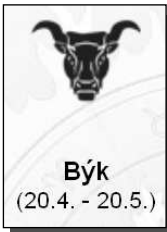
Býk (20.4. - 20.5.)

Menšia dominantnosť, ktorá sa vo vás zobúdzá, nikomu neuškodí. Preto je úplne v poriadku, keď ju pustíte von a tým sa zároveň vyhnete akémusi sebatryzneniu. Okrem toho by ste mali viac počúvať, dostáva sa k vám veľmi veľa cenných rád, ktoré by nemali zostať nevypočuté a nepovšimnuté. Veľmi vám pomôžu svojim prístupom hlavne staršie, vyzretejšie osoby, ktoré vedia, o čom život je. Očakávajte pestrejší spoločenský život, ktorý vás vtiahne do víru skvelej zábavy, kde sa uvoľníte a vypnete.