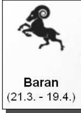
Baran (21.3. - 19.4.)

Hľadíte až príliš ďaleko dopredu. Je to síce fajn mať predstavu o budúcnosti, ale vám začína utekať a unikať realita, ktorá prebieha tu a teraz. Vízio o tom, ako by to všetko malo byť, radšej preneste do daného konkrétneho dňa, čím sa vyhnete len teoretizovaniu a rovno začnete podľa toho žiť. Neuškodil by vám ani zdravý nadhľad (v napojení na okolie a ľudí), od ktorého ste akosi upustili a spadáte viac do akéhosi diktátorstva a rozkazovania, čo niekto môže brať ako zneužívanie.