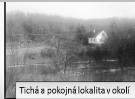
Tichá a pokojná lokalita v okolí