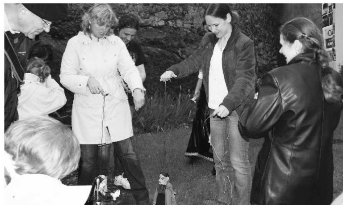
Z družobného Písku v Čechách prišli bábkoherci z Loutkového spolku NITKA