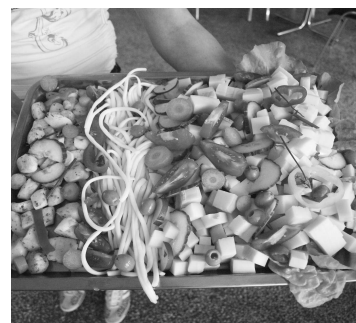
Deťom najviac chutili syrové výrobky z Plachtinskej farmy Baránek