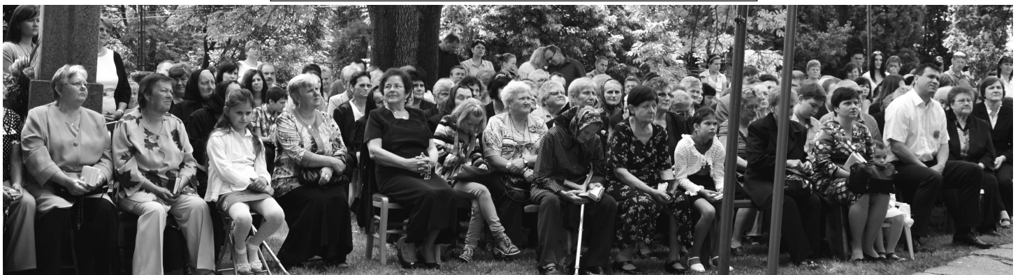
Pre neninských veriacich ostane tento deň navždy pamätným