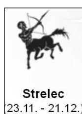
Strelec (23.11. - 21.12.)

Všetko je u vás v poriadku. Čo sa malo doriešiť, sa dokončieva a vy sa budete cítiť lahučky ako pierko. Dokonca aj konflikt medzi vami a známym sa urovná. Celkovo neočakávajte žiadne extrémny na žiadnom poli. Plynulý priebeh dní vám prinesie rodinnú pohodu. Vytvorí sa vám viac voľného času, ktorý je dobré venovať hlavne rodine, deťom a potom priateľom. Nenútenosť je presne to, čo by ste mali vpustiť do svojho života, vďaka čomu si ho budete viac vychutnávať.