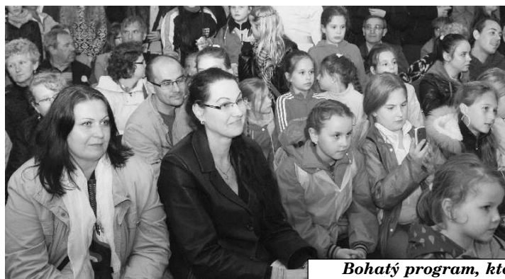
Bohatý program, ktorý otvoril hradnú sezónu potešil mnohých divákov