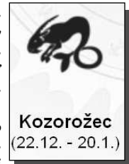
Kozorožec (22.12. - 20.1.)

Potichu sa k vám plazia negatívnejšie pocity – strach, obavy a v prvom rade bezmocnosť pohnúť so záležitosťami. Ste skvelí teoretici, ktorí majú radi všetko premyslené, ale pri premetnutí do skutočnosti vám vždy konečný výsledok skreslí vaša výbušnosť, nervozita a unáhlenosť. Pokúste sa popracovať na trpezlivosti, ktorá všetko „vypiluje“ k tomu, že sa vám to podarí podľa vašich predstáv. Chcelo by to z vašej strany aj viac prejavov lásky, vďaka, nehy, pocitov k najbližším a milovaným. Je na mieste, aby ste mali radi aj sami seba...