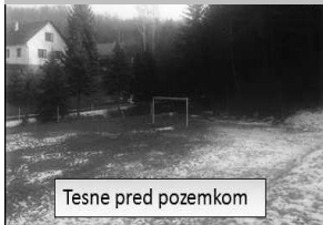
Tesne pred pozemkom

■ Predám stavebný pozemok v okrese Veľký Krtíš v obci Nová Ves. Rozloha 33 árov, cena dohodou. Inf. 0908 09 11 23. np - 538