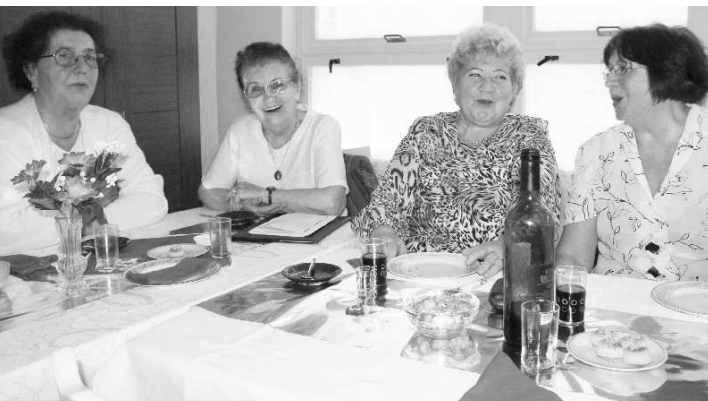
O dobrú náladu počas osláv Dňa matiek v klube dôchodcov sa spevom postarali aj členky spevokolu Nádej