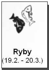
Ryby (19.2. - 20.3.)

Podporenú máte všeobecne aj komunikatívnu, čo sa po stará aj o skvelé výsledky v práci. Len si dávajte pozor, aby ste neskľzli do papulnatosti a odvrávania tam, kde si to „nemôžete dovoliť“. Osamelé „ryby“ by sa mali sústreďiť na vzdelávanie, láska si vás nájde sama.