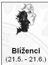
Blíženci (21.5. - 21.6.)

Ste ako loď na mori, ktorá sa hojdá striedavo na menších a väčších vlnách vytváraných vonkajším okolím. Máte tendenciu bojovať, ale pre tentokrát je lepšie splynúť s rytmom vln a naladiť sa na ich pravidelnosť, čím sa vám podarí dokonalé zladenie a vyhnete sa problémom. V prípade, že budete bojovať, budete viac viditeľnejšími a o to skôr narazíte na skaly alebo si vás okolie podmaní natoľko, že pôjdete ku dnu alebo utrpíte karambol. Jednoducho povedané, prijímajte dianie a situácie počas dňa s pokojom, na kopanie nohami ešte pride čas.