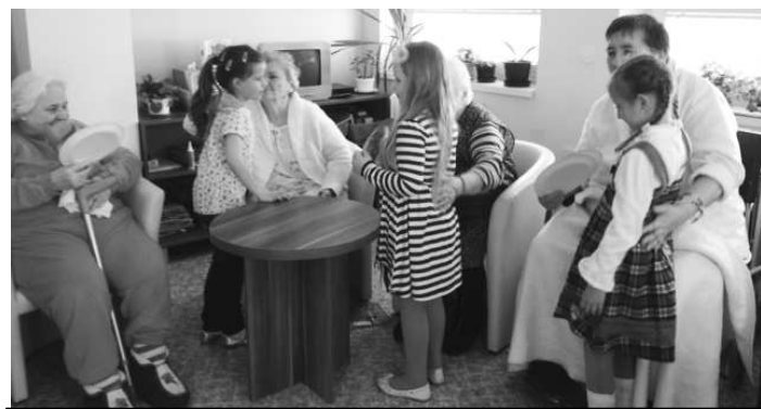
Starenky prišli pozdraviť aj deti z Materskej školy z Poľnej ulice, ktoré pásmom básničiek a pesničiek uvili pre klientky krásnu kyticu. Na záver im deti venovali deti vlastnoručne vyrobené darčeky.

V novodobej histórii ľudstva sa Deň matiek dostal do povedomia na prelome 19. a 20. storočia. Zásľuhu na tom má Američanka Anna Marie Jarvisová, ktorá v roku 1907 navrhla vzdať hold svojej mame a všetkým matkám sveta. Lobizmus dám spôsobil, že Kongres USA vyhlásil 8. mája 1914 druhú májovú nedeľu za Deň matiek. Prezident Woodrow Wilson neskôr podpísal dokument, v ktorom bol Deň matiek definovaný ako celoamerický národný sviatok. Dátum druhej májovej nedeľe sa potom rozhodli prijať za svoj mnohé krajiny na svete.