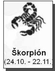
Škorpión (24.10. - 22.11.)

Vy po tieto dni príliš nevystarkujte svoje rozky, nedopadlo by to najlepšie. Ste tak v zápale pre spravodlivosť a svoju vlastnú pravdu, že ste náchylní veľmi rýchlo spadať do hádok a slovných (niektorí aj do fyzických) potýčok. Veľmi rýchlo vzplaniete a zahoríte, skúste to mať pod kontrolou, ste dostatočne silní, aby ste to ukorigovali. Počas týždňa budete ako zápalka, ktorou nehodno škrtnúť. Tí, o niečo pokojnejší, sa utiahu do svojho vnútorného sveta, prípadne sa budú venovať svojej duchovnému rastu a analyzovaniu.