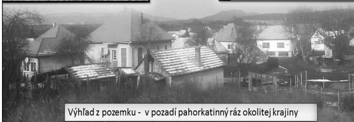
Výhľad z pozemku - v pozadí pahorkatinný ráz okolitej krajiny

● FIRMA VYKÚPI VAŠU NEHNUTELNOSŤ VO VEĽKOM KRTÍŠI A OKOLÍ. (VAŠE PRÍPADNÉ DLŽOBY A EXEKÚCIE VYPLATÍME!) PLATBA V HOTOVOSTI. Inf. ☎ 0907 48 48 40. np - 573