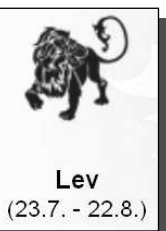
Lev (23.7. - 22.8.)

Pokoj šíriaci sa okolo vás využite na dokončenie rozrobených prác (ženských aj mužských) v domácnostiach a záhradách. Budete sa venovať zvelaďovaniu okolia a miesta, v ktorom žijete a tým viac prispejete k svojej pohode. Naskočili ste a nabehli na určité životné tempo, ktoré sa vám začína páčiť a vychutnávate si všetko, čo do dňa prichádza. Usídlil sa vo vás pokoj a harmónia, ktoré sú pre túto dobu vzácné. Týždeň v znamení zvelaďovania a dotvárania.